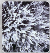
26 יום לאחר היישום