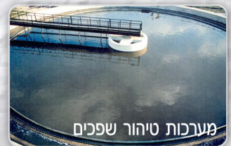
מערכות טיהור שפכים