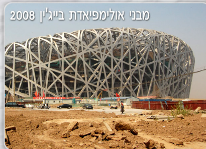
מבני אולימפיאדת בייג'ין 2008